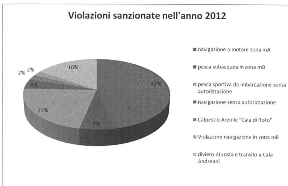
Fig. 1: Rappresentazione in percentuale delle tipologie di violazioni sanzionate dal CTA nell'area del Parco Nazionale nell'anno 2012.

Vigilanza e sorveglianza e attività di repressione nelle zone a riserva integrale terrestri e marine. In particolar modo dovranno essere concordate delle strategie per arginare le violazioni più frequenti registrate nell'anno 2012(Fig. 1).