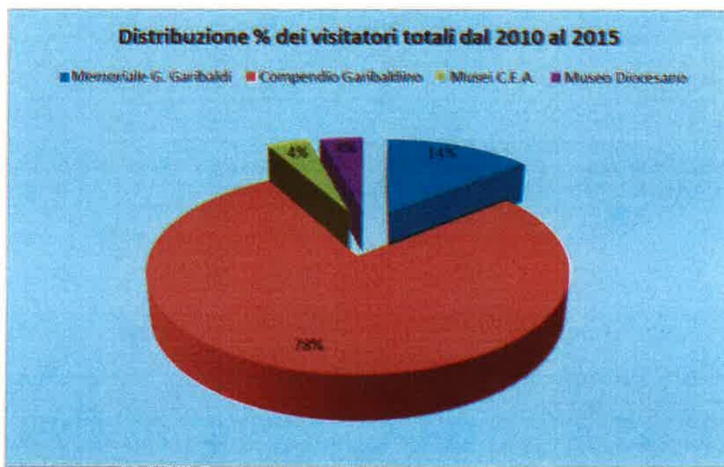
Fig. n. 1: numero di visitatori dei diversi musei in percentuale.

Il Compendio Garibaldino, che ospita la casa e la tomba dell'eroe risorgimentale, è uno dei musei storici più visitati d'Italia, ed è stato visitato dall'78% dei fruitori museali complessivi.